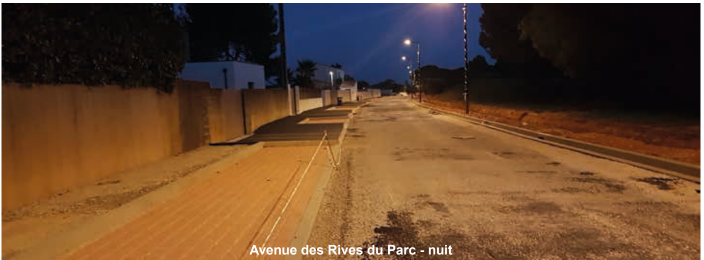
Avenue des Rives du Parc - nuit