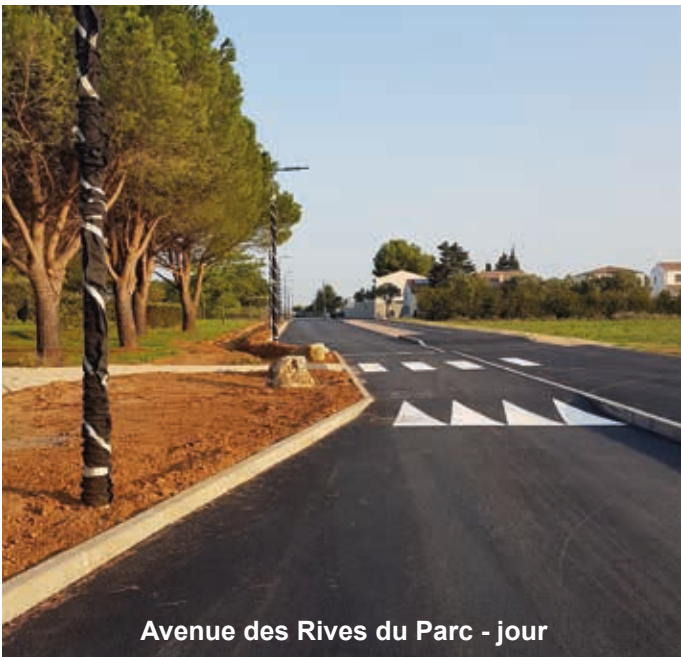
Avenue des Rives du Parc - jour

Les travaux de voirie et de réseaux de la rue du Jardin ont été, quant à eux, réceptionnés au mois de mars.